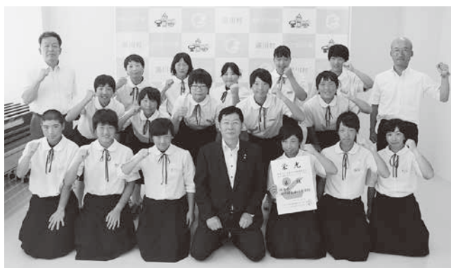
三澤村長と選手の皆さん