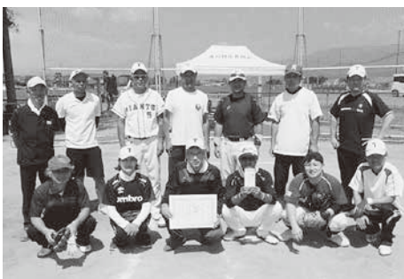
優勝の高瀬チーム

8月7日(日)村営野球場において村民ソフトボール大会を開催しました。今年も、8チームが参加し、炎天下の中で、気温にも負けない熱戦を繰り広げました。決勝は高瀬チームと中ノ目チームの対戦となりました。決勝まで圧倒的な強さで勝ち上がった両チームは序盤から点の取り合いとなり、結果、14対11で高瀬チームの優勝となりました。 参加者の皆さん熱い中、大変お疲れ様でした。結果は次のとおりです。