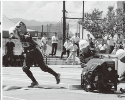
消防ホースを担いでの力走!!