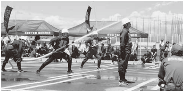
ポンプ車操法による放水作業

7月31日(日)に『第40回福島県消防操法大会両沼地方予選会』が会津坂下町の鶴沼球場北側駐車場において開催されました。 本村代表として、ポンプ車操法の部に第1分団第1部(笈川・王領・上田谷地班)が、小型ポンプ操法の部に第1分団第3部(八日町・森台班)が出場しました。 両チームとも、6月初めから2ヶ月間にわたり、朝早くからの訓練を積み重ね大会に挑み、当日は大変厳しい暑さ