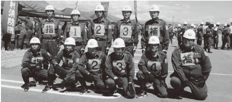
大会に出場した選手の皆さん