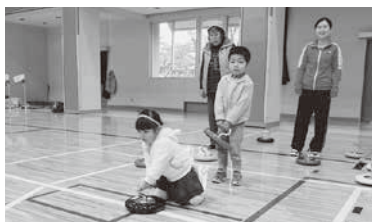
カローリングを体験

11月8日(日)湯川村体育館で第3回ゆがわスポーツフェスティバルを開催しました。あいにくの雨模様でしたが、カローリング、スポーツ吹き矢、ゲートボール、グラウンドゴルフ、卓球の5種目の体験教室を行いました。各種目、スポーツ推進委員をはじめ種目団体員が参加者に丁寧に教え普段体験することのできないニユースポーツを体験する一日となりました。