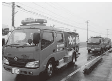
消防車両等での防火パレード