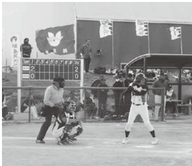
3回戦相馬チームとの対戦様子

10月17日(土)より第2回市町村対抗福島県ソフトボール大会が相馬市光陽ソフトボール場にて開催されました。初戦湯川村チームは、桑折町チームと対戦し9対2の5回コールドで悲願の一回戦を突破すると、勢いそのままに2回戦、白河市チームにも11対1でコールド勝ちをおさめました。チームの快進撃は続き、3回戦、地元、相馬市チーム相手にも10対9と接戦を制し、53チーム中、ベスト8と大躍進を見せました。準々決勝で下郷町に9対13とベスト4まではあと一步のところまで敗れましたが、湯川旋風を巻き起こす結果となりました。選手の皆さん大変お疲れさまでした。