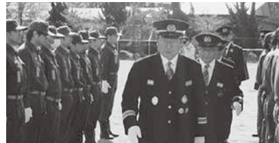
通常点検を受ける消防団員

秋の晴天の中で通常点検や特別訓練が行われ、最後は堂々とした分列行進を行い、生気あふれる姿で実施した両消防団に来賓の方々から称賛のお言葉をいただきました。