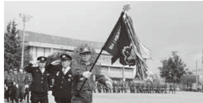
消防団員による分列行進