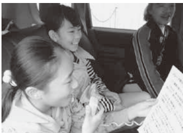
火災予防を呼びかける少年消防クラブ員