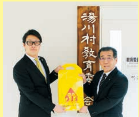
ランドセルカバーを贈呈する 澁谷会長(左)

寄贈いただいたランドセルカバーは、4月に入学する新1年生のために、各小学校へお渡しいたします。