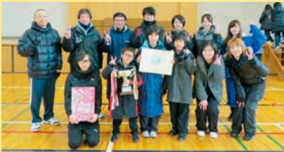
優勝の上扇田チーム