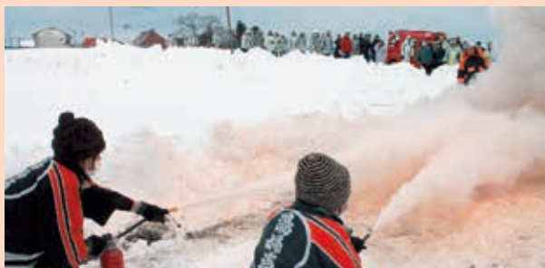
婦人消防クラブ員による模擬火災消火訓練