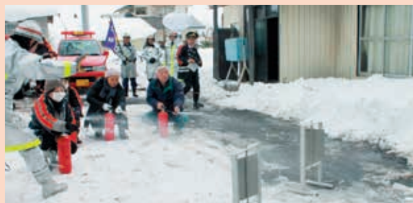
婦人消防クラブ員と上樽川地区住民による初期消火訓練