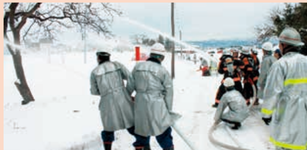
消防団員と十文字所員による放水訓練