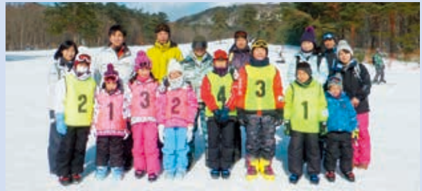
晴天の雪原で集合写真！