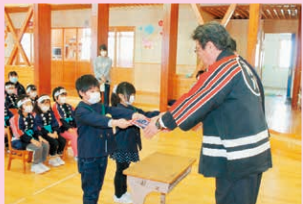
ハッピーを返還するクラブ員