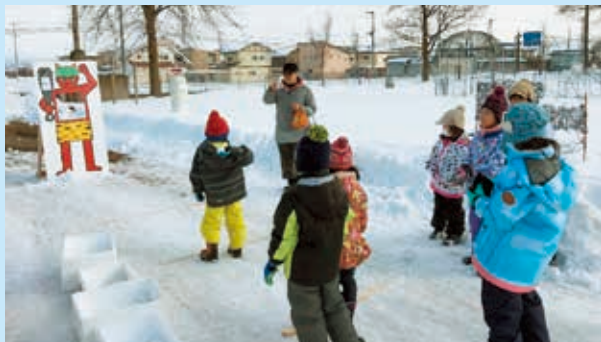
節分にちなみ、鬼の的に雪投げをする子どもたち

多くの子どもたち、村民の方においでいただき、参加した子どもたちは寒さに負けず冬の遊びを楽しんでいました。