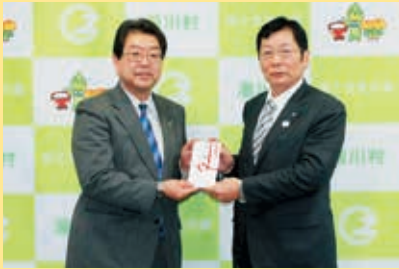
千葉会津若松支社長と三澤村長

2月2日(金)、東北電力株式会社社会津若松支社様から街路灯15灯を寄贈いただきました。寄贈していただいた街路灯を活用し、より安全安全な村づくりに努めてまいります。