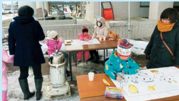
灯ろうの絵を描く子どもたち