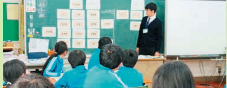
税金について学ぶ子どもたち

子どもたちは、講師の話に熱心に耳を傾けており、税金の大切さについて学ぶことができました。