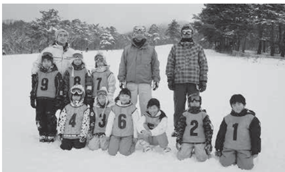
雪原でみんな揃って集合写真！

1月17日(日)、24日(日)の2週に渡って猪苗代スキー場で湯川村スキークラブによるスキー教室を開催しました。今年是小雪が心配されましたが、実施日は積雪にも恵まれ、のべ20名の子ども達が参加しました。参加者は講師の先生のアドバイスに真剣に耳を傾け、転びながらも少しでも上達できるように取り組んでいる様子でした。講師のスキークラブ員はやさしく丁寧な指導と評判で、子ども達の笑顔あふれる一日となりました。来年度も実施する際はぜひご参加ください。