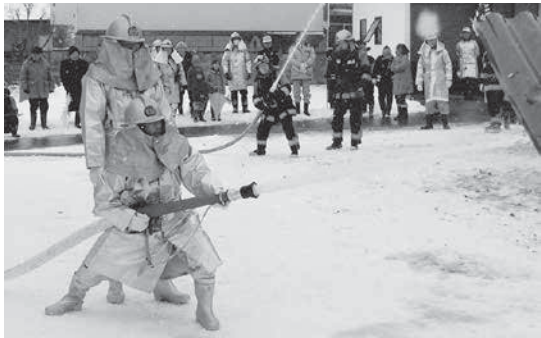
消防団員・消防所員による消火活動

毎年、「文化財防火デー」の1月26日を中心に、全国的に文化財防火運動が展開されており、本村でも、火災が発生した際の被害拡大(延焼)防止を目的として、1月24日(日)に熊川地区の萬福寺において、「平成27年度湯川村文化財防火訓練」を実施しました。 訓練には村長はじめ、消防団、教育委員会、各関係機関及び熊川地区住民が参加し、消防団員・会津若松消防署十文字出張所員による安全・迅速な消火活動のほか、熊川地区住民や婦人消防クラブ員による模擬火災消火訓練等を行いました。