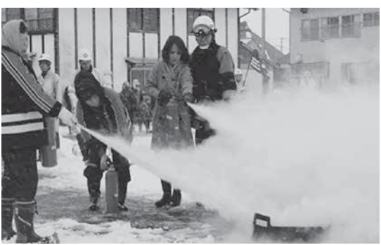
婦人消防クラブ員による模擬火災消火訓練

先人の残した大切な文化財を後世に伝えるため、今後も村民の皆様のご協力をお願いいたします。