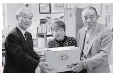
ありがとうございます。ありがとうございました。

11月13日(火)湯川村老人クラブ連合会様より、ふきん・雑巾の贈呈がございました。