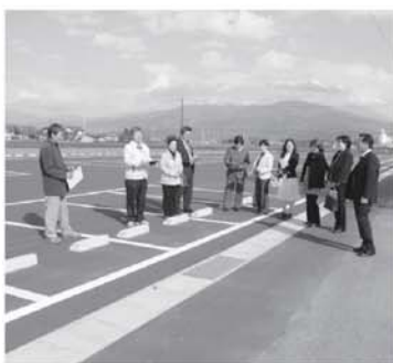
星教育長から、増設した駐車場の説明を受けている参加者の皆さん

午後には、除染工事を完了した村営野球場を訪れ、新たに設置した女子及び身障者用トイレと北側に増設した普通車114台を収容できる駐車場を視察し、村教育委員会が本年度実施した事業への理解を深めていただきました。