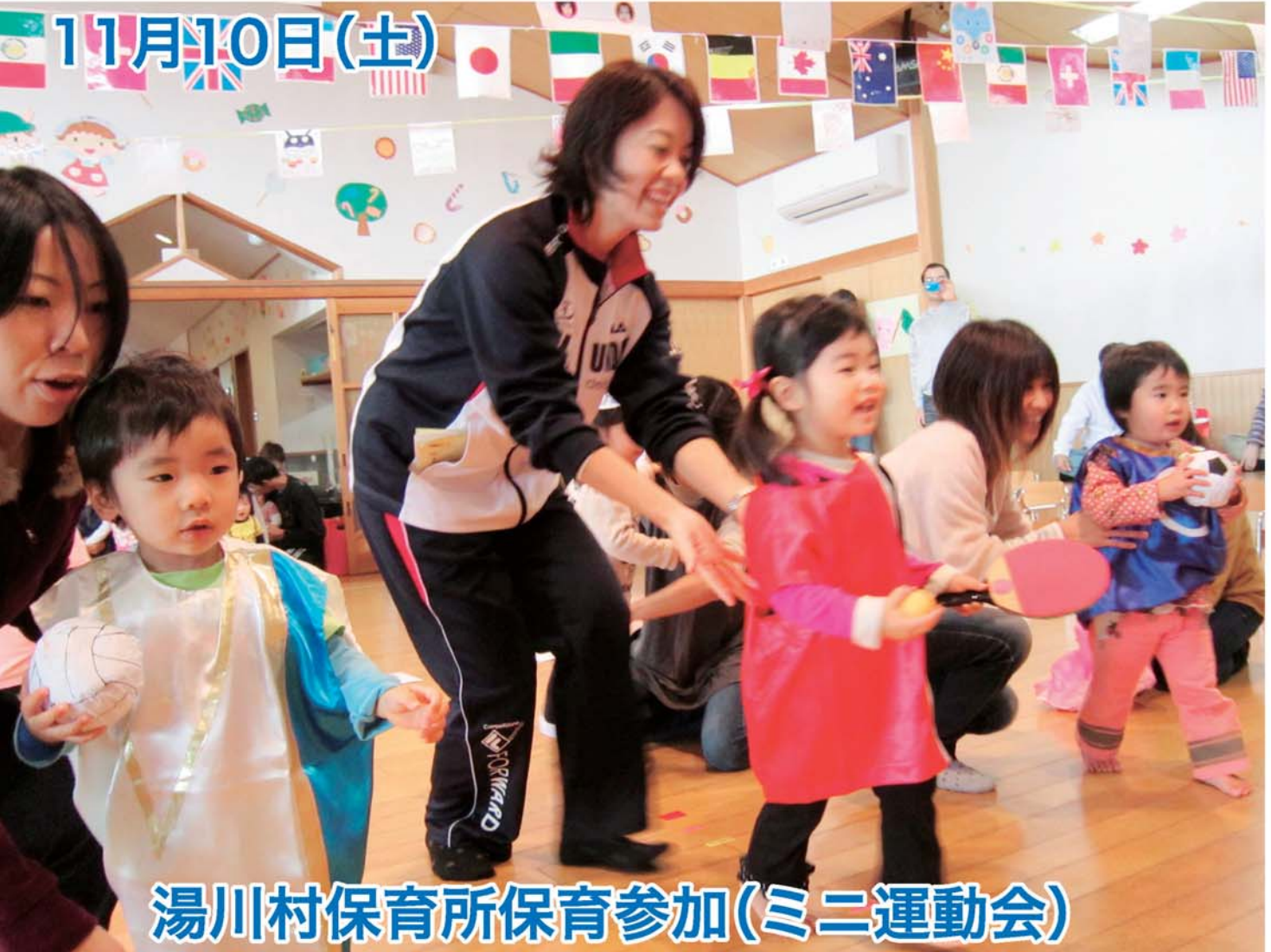
湯川村保育所保育参加(ミニ運動会)