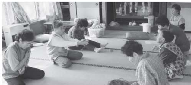
お手玉同時一個投げは容易でも、二個は難しい！