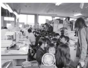
星教育長から、増設した駐車場の説明を受けている参加者の皆さん

この訪問は笈川、勝常幼稚園時代からの行事で何十年も続いているもので、役場の見学や仕事の説明を頂いたり、駐在所や交通指導員の仕事、公民館、郵便局の仕事の説明を頂き、様々な仕事の大切さを理解した訪問でした。