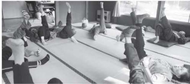
畳の上のシンクロナイズド？足が揃っていききれいですね