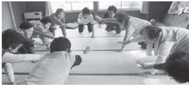
バランス運動です