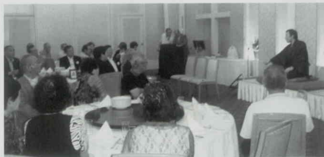
第25回記念行事「落語観賞会」

懇親会では湯川村で採れたきゅうりやトマトを食べさせていただき、ふるさとの味に舌鼓をうちつつ、故郷の思い出話や久しぶりの再会に楽しいひと時を過ごしました。終わりに、今後ますます会が盛んに活動していくことを誓い合って終了いたしました。