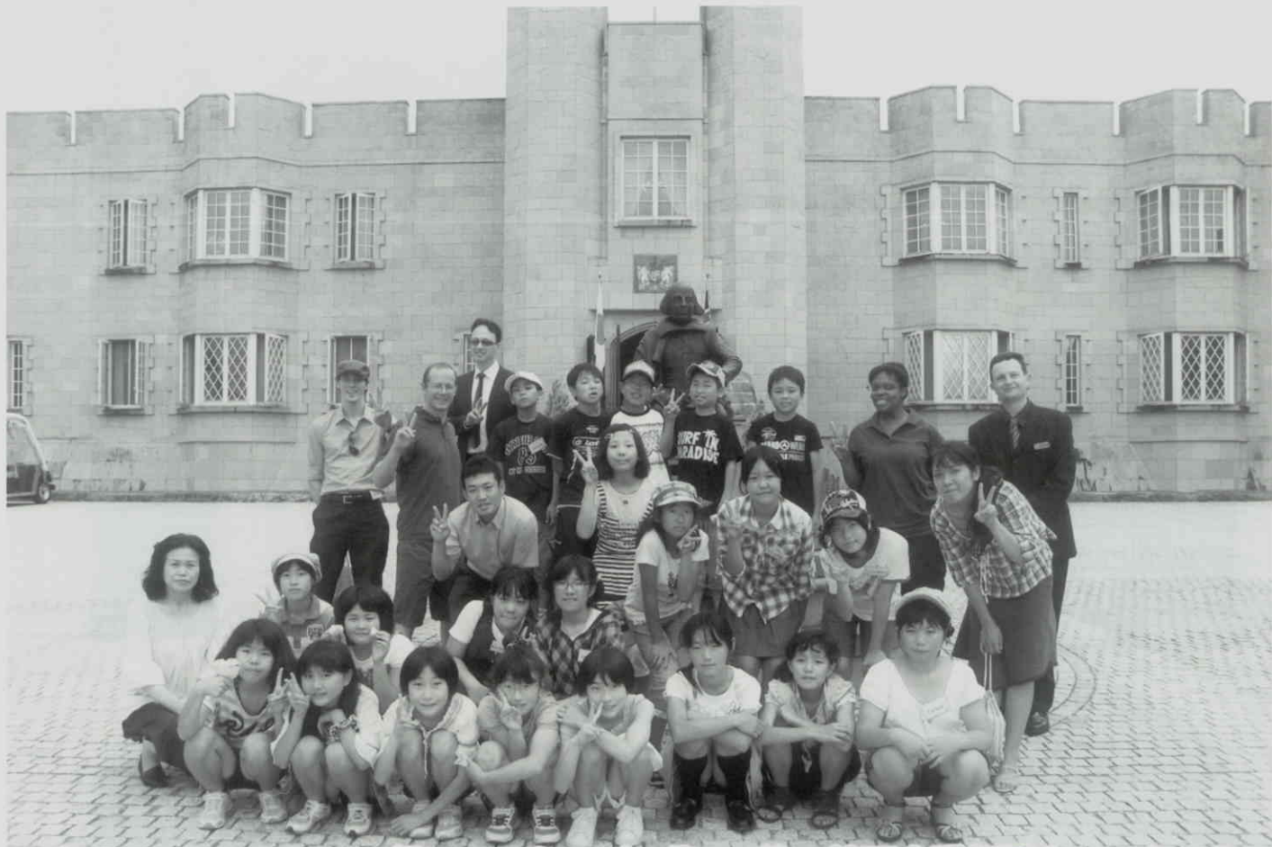
ブリティッシュ・ヒルズ「シェークスピア像」の前で外国人講師達といっしょに