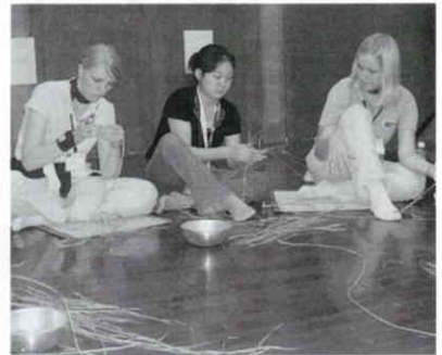
ヒロロコースター作りに挑戦しました。