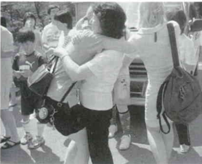
受入家族ともいよいよお別れです。

れあいや中学生とのソフトボールの親善試合、湯川村の高校生とのスポーツや学校生活についての話し合いや剣道の試合の見学、物作りの体験、また会津の観光地見学など多すぎず少なすぎずの内容でドイツ団員には好評のようだったようです。 今回の交流を通して日独両国親善の架け橋となり、今後のスポ少活動にも大きな影響を与えることを期待したいものです。