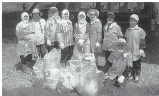
暑い中 ご苦労さまでした