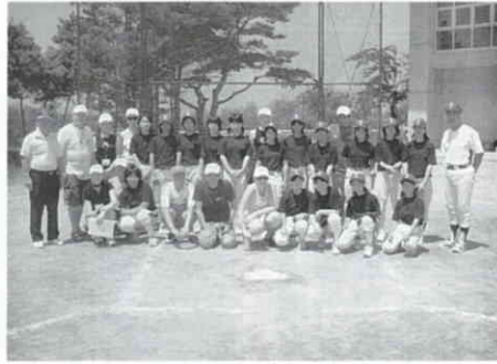
湯川中ソフト部との親善試合を行いました。

れあいや中学生とのソフトボールの親善試合、湯川村の高校生とのスポーツや学校生活についての話し合いや剣道の試合の見学、物作りの体験、また会津の観光地見学など多すぎず少なすぎずの内容でドイツ団員には好評のようだったようです。 今回の交流を通して日独両国親善の架け橋となり、今後のスポ少活動にも大きな影響を与えることを期待したいものです。