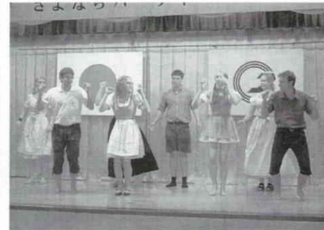
バイエルン地方のダンスを披露してくれました。