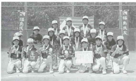
健闘した勝常女子チーム

8月5日(土)・6日(日)の両日にわたりいわき市において開催されました。勝常女子チームは初戦から大差をつけて勝ち進み、準決勝においては同点となりましたが、運の強さも手伝つて見事決勝に進むことが出来ました。決勝戦においてはいつものチームプレーを見せて善戦したものの相手チームのねばり強い守備や攻撃が上回り、結果準優勝となりました。