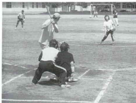
好プレーいっぱいのゲーム