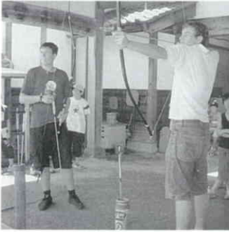
弓道も体験しました。