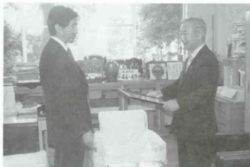
長門会津地方振興局長から大塚村長へ

この栄誉は、村民一人一人の税に対する意識が高く、日頃より納税についてご理解とご協力を頂いていることにより成し得たものと深く感謝申し上げます。今後も継続して完納できますよう皆様のお力添えをお願いいたします。