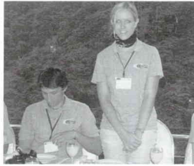
歓迎レセプション