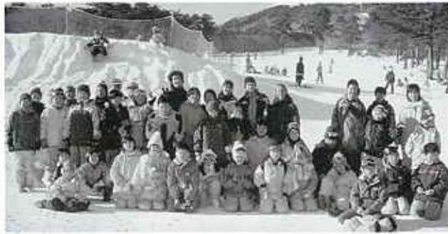
参加された皆さん

1月15日、1月29日の2日間にわたりスキー・スノーボード教室が猪苗代スキー場で行われました。 両日とも穏やかな天気で、村のスキークラブ員の指導で各班に分かれて楽しく過ごしました。毎年小学生の参加が多いのですが、大人の方の参加も歓迎いたします。 来年も実施いたしますので村民皆さんの参加をお待ちしております。