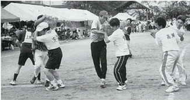
△ 重いぞ、おとすなよ!