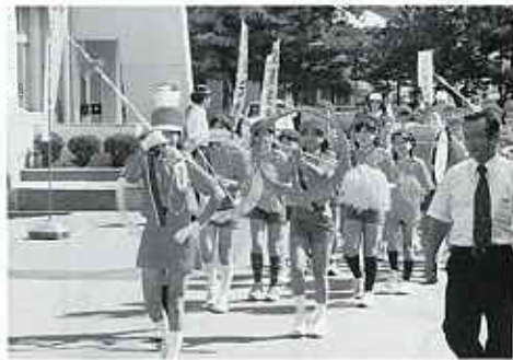
△ 勝常小学校鼓笛隊

9月16日(金)秋の全国交通安全運動の一環として笈川・勝常両小学校児童、両幼稚園児による交通安全鼓笛隊パレードが村公民館前スタートで行われました。