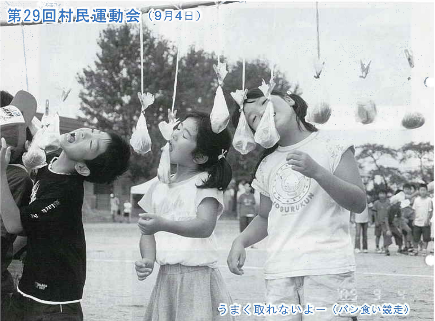
うまく取れないよー (パン食い競走)