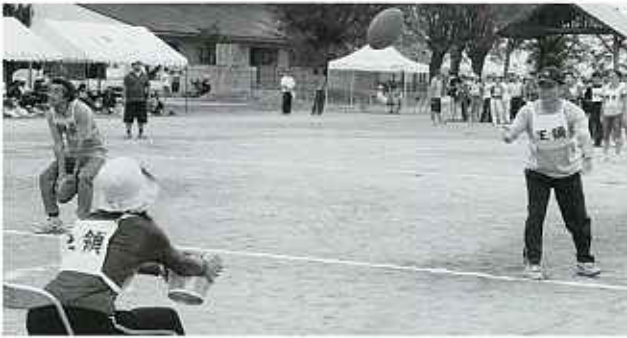
△ しっかり受けとめて。