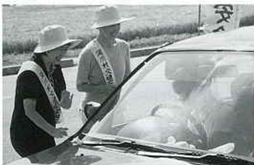
△ 安全運転を呼びかける母の会の皆さん

また、午後からは熊川の待避所で交対協役員、交通安全協会湯川分会、交通安全母の会により街頭ふれあいキャンペーンが実施され、母の会の皆さんが作った折り鶴や湯川米をドライバーに配り安全運転を呼びかけました。