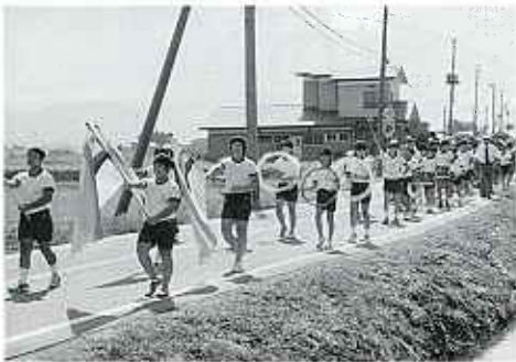
△ 笈川小学校鼓笛隊