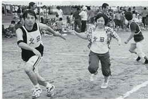
△ 後は頼むわよ!! (800mリレー)

おわりに、実行委員、運営委員をはじめ、今大会にご協力いただきました関係者の皆様に感謝を申し上げます。