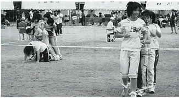
△ 息ピッタリでゴール!!

前日からの空模様で開催が心配されましたが、雨も降らず絶好のコンディションで行うことができました。今年は昨年より1種目少なくなりましたが、競技方法を変えたりしたため全体的にスムーズな運営になったようです。