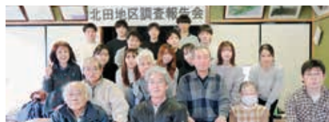
北田地区と福島大学生の皆さん