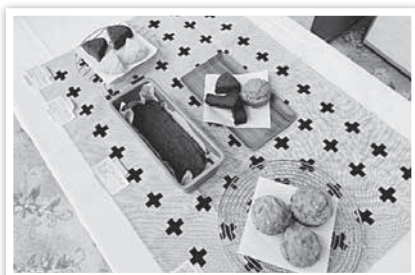
左から、米粉スコーン/米粉と豆腐の ガトーショコラ/米粉のバナナマフィン

また、湯川村で生活をさせていただきながら、イベント活動を通して湯川村のを知ることができ、湯川村のこの場所や人々が大好きになりました。温かく迎え入れていただき、本当に感謝の気持ちでいっぱいです。関わってくださった皆さんに恩を返していけるよう、これから湯川村でやりたい活動が沢山あります。2年目はさらに結果に繋がる挑戦をしていきたいと考えています。4月からどうぞ宜しくお願いします。