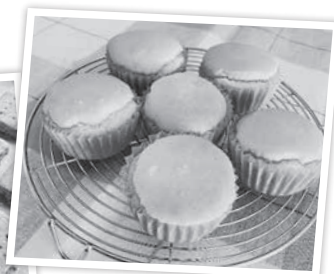
米粉のメープルマフィン

ふくしま6次化創業塾の卒塾式の日に出展しました。その他にも、米粉を使用した豆腐ドーナツや、クッキーなど試作を行っています。商品開発に向けて少しずつ形にしていきたいです。村民の皆さんに完成した米粉のお菓子を知っていただける機会をこれからイベント等で作ってきたいです。