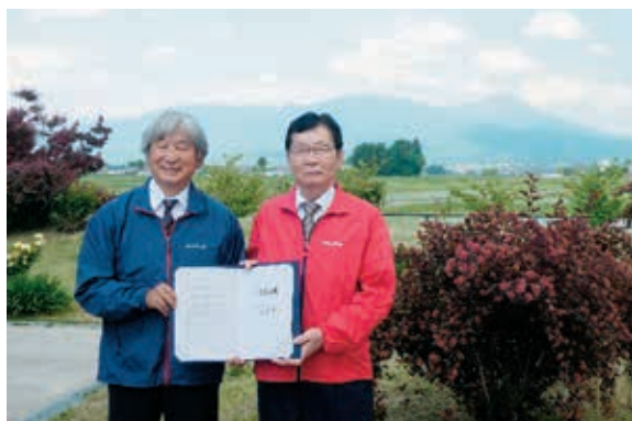
協定書を持つモンベル会長(左)と三澤村長(右)