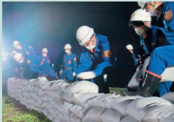
積み土のう工を実施する消防団員