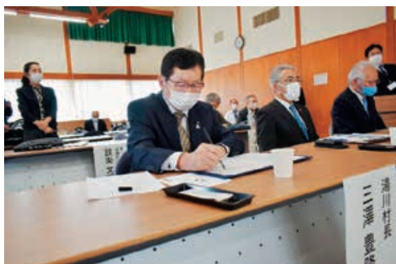
協定書に署名する三澤村長