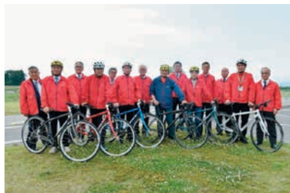
サイクリング前 関係機関の長