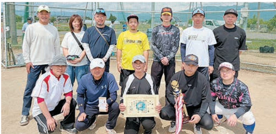
優勝した高瀬チーム