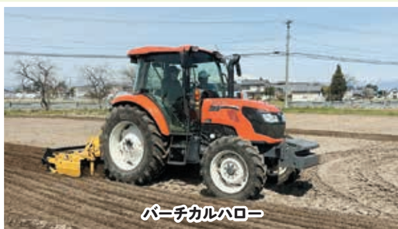
バッチカルハロー

今年はスーパーエルニーニョが発生すると予報されています。暑さも厳しくなるとのことで、皆様も熱中症には十分お気をつけてお過ごしください。