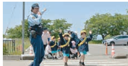
横断歩道を渡る園児たち