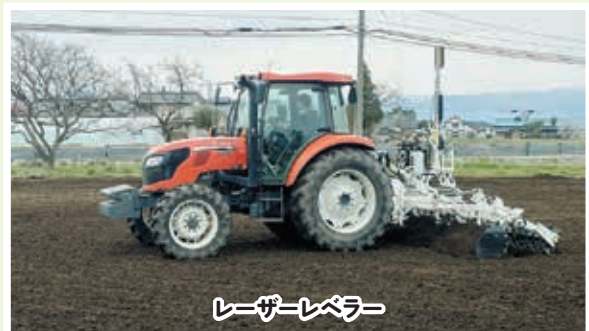
レーザーレベラー