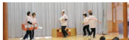
交通安全に関する劇(交通安全母の会)