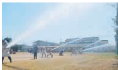
機械器具点検(水出し)