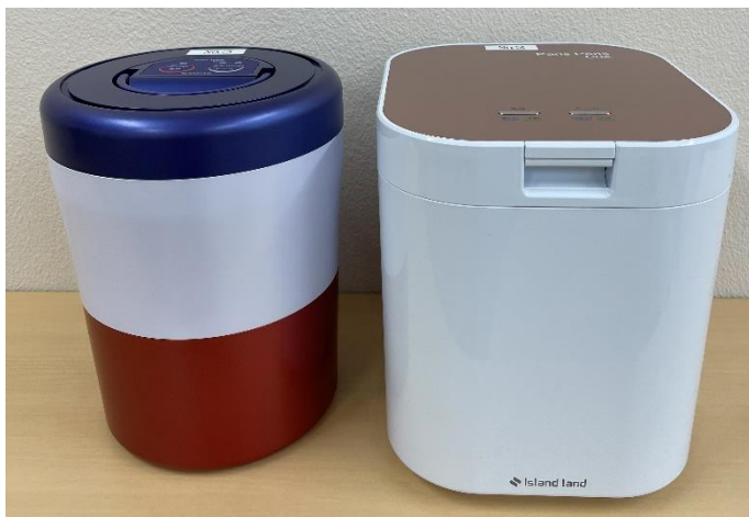
(左側：パリパリキューライト、右側：パリパリキュー)