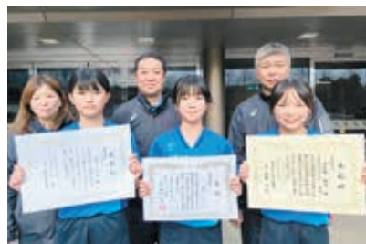
受賞された皆さん