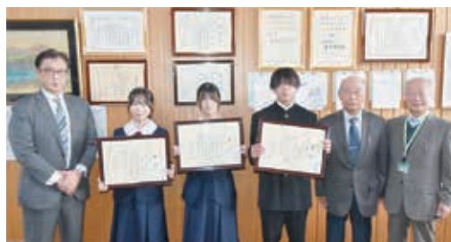
受賞された皆さん