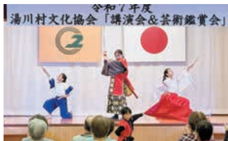
蒲生氏郷を演じる小中高校生、 チーム獅(レオ)の皆様