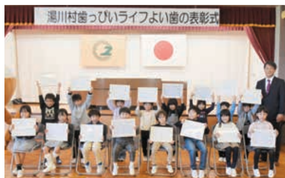
「よい歯の子」受賞者