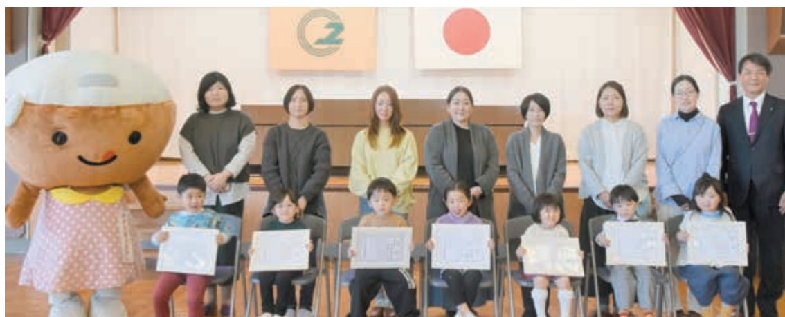
「よい歯の親子」受賞者