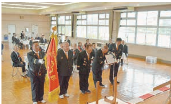
消防団幹部による受賞報告

なお、受賞を記念して予定されていたパレードは、あいにくの雨のため中止となりましたが、今後表彰旗は役場庁舎内に展示を予定しておりますので、機会がありましたらぜひご覧ください。