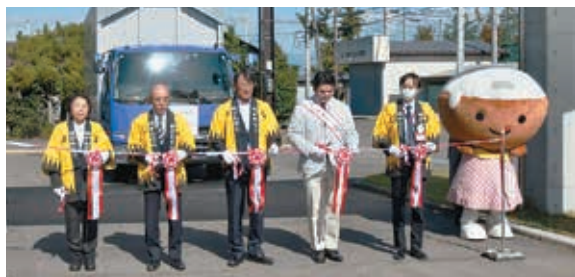
テープカットする関係者

なお、今年度の会津湯川米を返礼品とする「ふるさと応援寄附金」は、12月31日(水)まで受付しています。