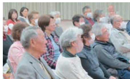
チーム獅(レオ)の世界観に 引き込まれる来場者