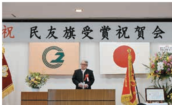
野崎代表取締役社長による祝辞