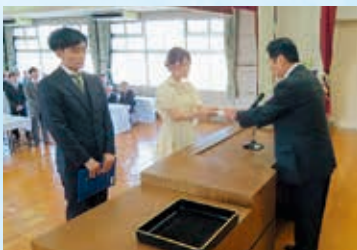
証書・記念品授与