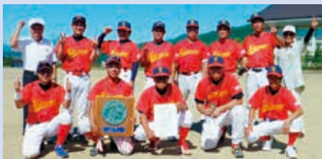
壮年ソフト競技優勝中ノ目チーム