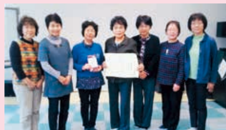
湯川村更生保護女性会役員の皆さん