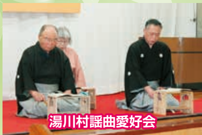
湯川村謡曲愛好会