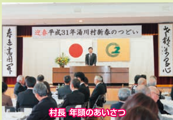
村長 年頭のあいさつ