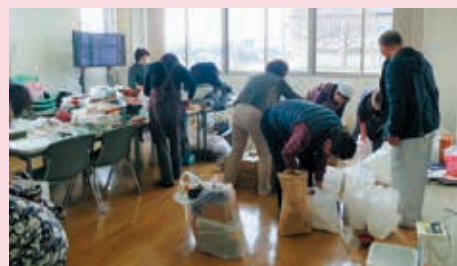
物資等荷造り作業の様子