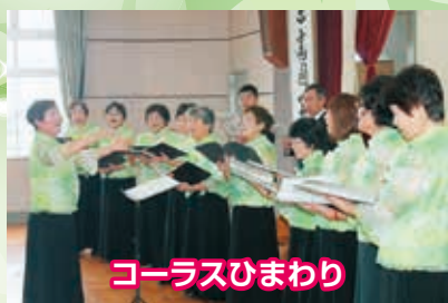
コーラスひまわり