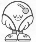
福島県 復興シンボルキャラクター キビタン

ワクチンを受けた方は、新型コロナウイルス感染症の発症を予防できると期待されていますが、ワクチンを受けた方から他人への感染をどの程度予防できるかはまだ分かりません。また、ワクチン接種が徐々に進んでいく段階では、すぐに多くの方が予防接種を受けられるわけではなく、ワクチンを受けた方も受けていない方も、共に社会生活を営んでいくことになります。