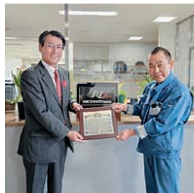
日東ユメックス株式会社 会津工場様