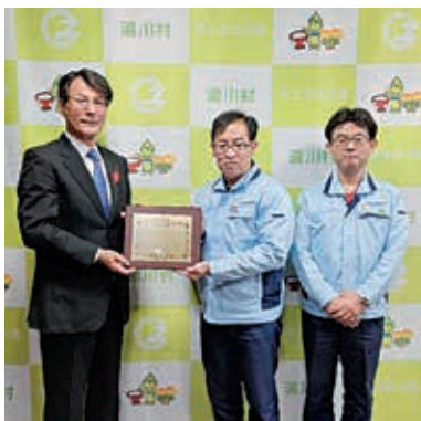
株式会社不二コントロールズ様

同企業・団体は長年に渡り、献血活動に協力いただいております、その功績が認められての受章となりました。