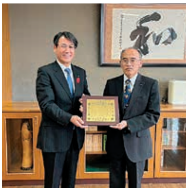
福島県農業共済組合 会津支所様