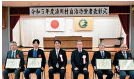
出席された受賞者の皆さん