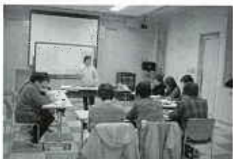
熱心にメモをとる 学級生

講演内容は、「糖尿病について」 でした。その中で「糖尿病はこ んな病気」「糖尿病は放っておく となぜ怖い」「肥満対策・予防も 大切」「肥満・糖尿病を予防する には」につ いて豊富な 資料をもと に分かり易 くお話をた だきました。 参加した学 級生も気軽 に質問し、 大変盛り上 がりました。