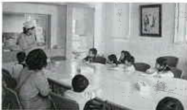
楽しいお話に集中

家庭教育子育て支援キティちゃん の会では、12月4日(日)10時か ら、ユースピアゆがわで「クリ スマス・お楽しみ会」を行いま した。5家族15人の参加でした が、子ども達は、お母さん達と ケーキ作りをしたり、ビンゴゲ ームをしたり、楽しいお話を聞い たりと、とても楽しく 過ごしました。 また、 プレゼント をもらった り、お昼に は、おにぎ りパーティ をして大満 足だったよ うです。