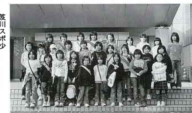
笈川スポ少 ドリームジュニアの皆さん

11月27日、笈川スポーツ少年団ドリームジュニアは埼玉県花園町より感謝状を受けました。平成2年より15年間に渡りソフトボールの交流を行ってきたことに対するものであり、来年より深谷市との合併を前に花園町スポーツ少年団結成25周年の式典の中で表彰されました。祝賀会においても今後とも交流を深めたいとの話がありました。