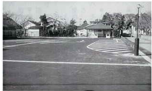
整備された湯川村駐車場

※スマートICとは、ETC(自動料金収受システム)専用インターチェンジのことで、ETC車載器を搭載した車両が出入できます。