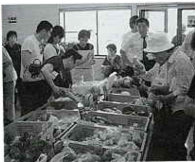
買い物客で賑わう店内