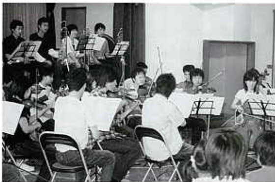
◀ 団員によるすばらしい演奏

児童から「初めて触ったし、弾かせてもらってうれしかった。」との感想がありました。保護者からは、「ひたむきな演奏に感動した。」「生演奏が聞けて良かった。」との意見が寄せられました。