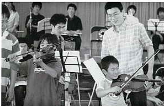
◀ 初めてヴァイオリンに触れる子供たち