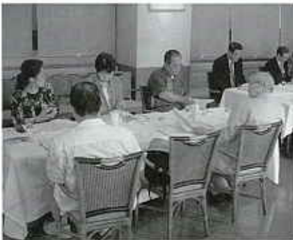
▲総会に集まった会員の方々

総会後の懇親会では、なつかしい故郷の思い出話がはずみ、また、カラオケ大会を開催するなど楽しいひとときを過ごされました。