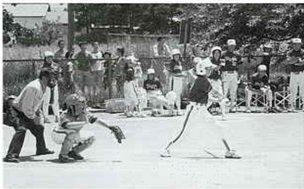
▶熱戦の勝常チーム

7月2日(土)・3日(日)、湯川村営野球場において民友旗争奪第23回女子ジュニアソフトボール大会会津予選会が開催され、勝常スポーツ女子が準優勝、笈川ドリムジュニアが3位と両チームそれぞれ健闘しました。県大会は8月6・7日に双葉町総合運動公園で行われ上位入賞の期待が高まっており、日頃の練習の成果が十分発揮出来ることを期待しています。