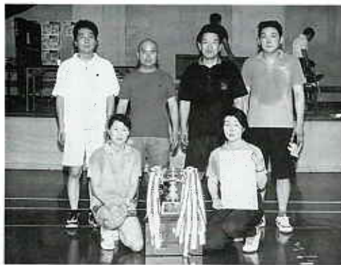
▶ 2年連続優勝の卓球チーム

7月10日(日)、昭和村において第58回県民スポーツ両沼大会が開催されました。湯川村からはソフトボール、家庭バレーボール、卓球、テニスの4種目が出場し、卓球が2年連続の優勝を果たし、テニス第3位になり共に8月7日(日)、柳津町で行われる会津地域大会に出場することになりました。