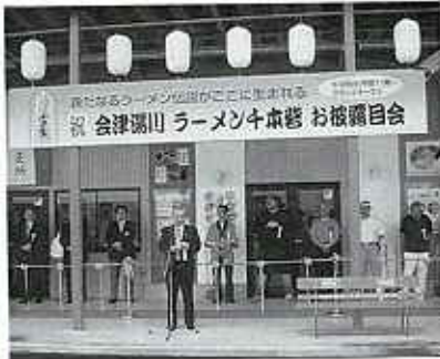
祝辞を述べる村長

去る6月28日、浜崎地内国道121号沿いにオープンした「湯川村特産品販売所」では、新鮮野菜やコメ、花などの農産物、そば粉、ジャムなどの農産加工品、EM石鹸、漆器などの商品が並べられ、連日大勢の買い物客で賑わっています。なお、販売所での出品者も随時募集していますので、販売を希望される方は販売組合事務局(村商工会)へご相談ください。