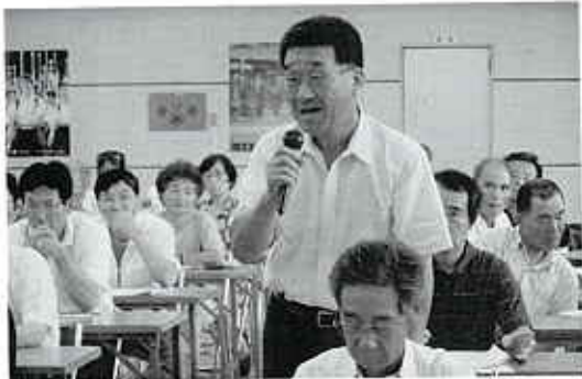
参加者からの質問