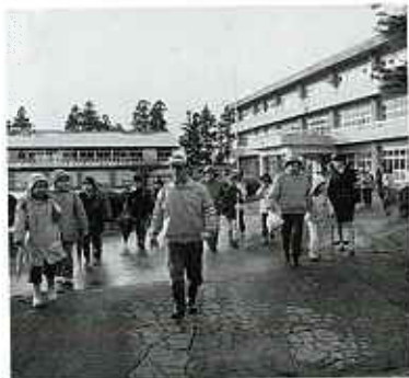
見守りたいの方々と帰る子供達