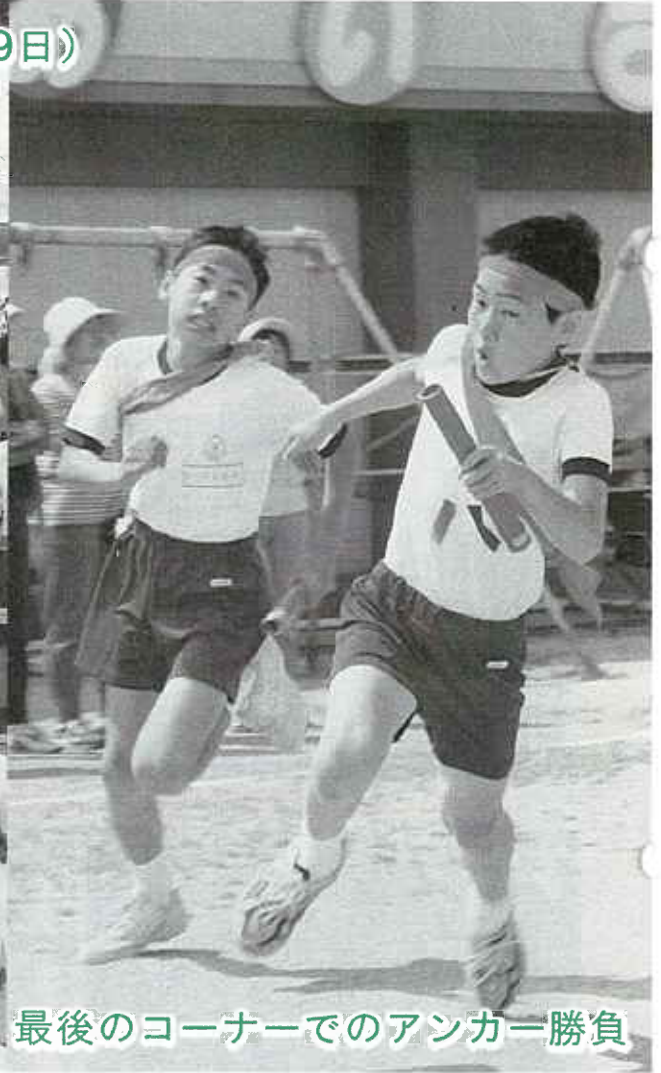
最後のコーナーでのアンカー勝負