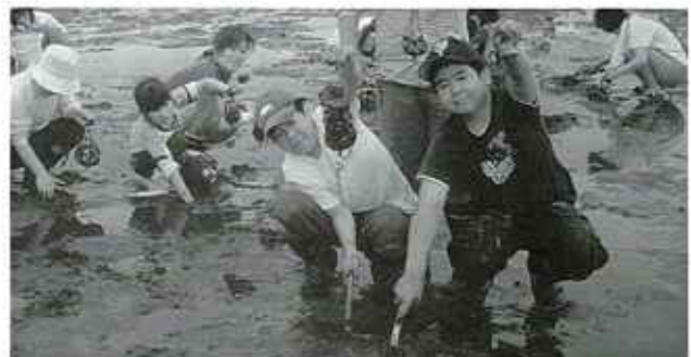
あさり いっぱい採れたよ

去る6月11日(土)、青少年探検隊第1回探検を実施しました。隊員41名、保護者9名が参加し、松川浦で潮干狩りを行いました。前日から当日の朝まで雨が降り、天候が危ぶまれましたが、隊員（参加児童・生徒）の心がけが良いせいで、雨も上がりが絶好のコンディションのもと潮干狩りができました。隊員は、潮風を全身に浴びながら、いろいろな貝を採ったり、かきを取ったりと、海での楽しい思い出をたくさん作ったようです。また、友達との輪も広がったようです。