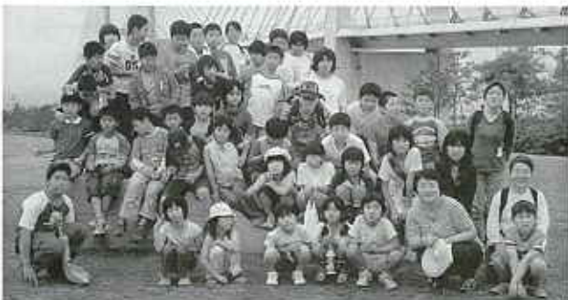
大勢の隊員が参加しました