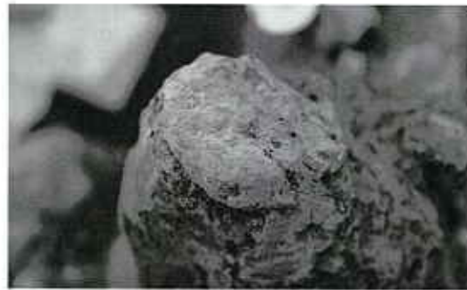
▲ ガラス質の不純物を含む鉄くず

見された木炭の破片を分析した結果、クリの木を燃料材に使用していたようです。しかし、遺跡で精製された鉄は発見されていません。どこにあるのでしょうか。