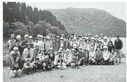
ハイキング参加者全員で