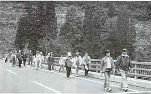
風景を楽しみながら

6月5日(日)、第10回村民ハイキングが行われました。前日の雨が引きずるかと思われましたが、曇りから晴れとハイキングには絶好の日となりました。太郎布高原に今が盛りと咲き誇るあざき大根の花を車中から眺めながら、途中で山菜などを採りながら沼沢湖の自然休養村センターまでの約5・5kmを全員で完走しました。昼食後は、妖精美術館で絵画、絵本、人形などを観賞したり、湖の周りを散策したりと楽しい一日を過ごしてきました。