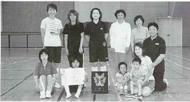
家庭バレーボール優勝 笈川チーム